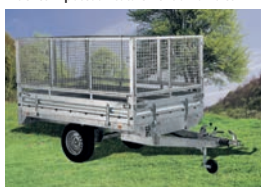
Ridelles + réhausse grillagée H.80 cm