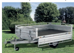
Ridelles + poteaux totalement amovibles