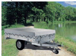
Ridelles + bâche plate + arceaux bâche plate